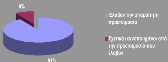
Επίπεδο προετοιμασίας συμμετεχόντων για επανένταξη στην αγορά εργασίας